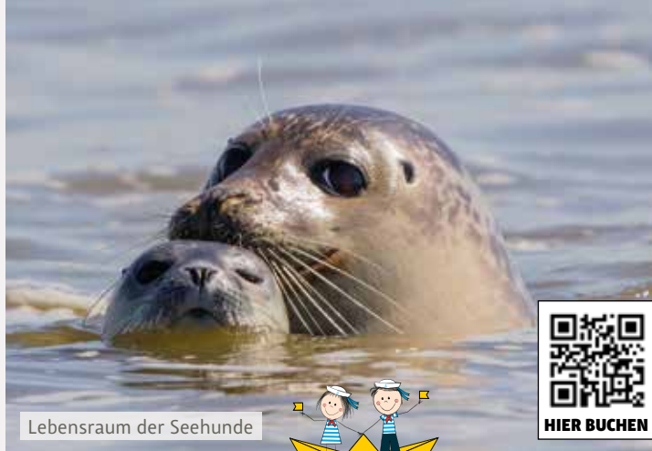
Lebensraum der Seehunde