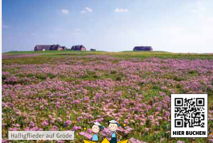
Halligflieder auf Gröde